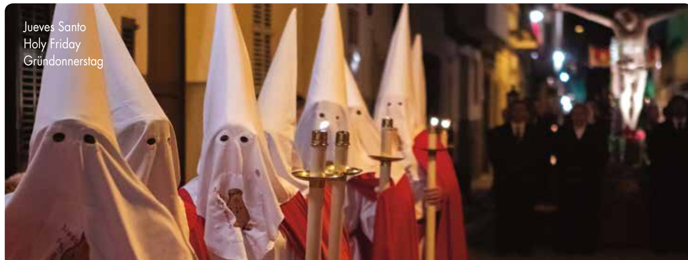
Jueves Santo Holy Friday Gründonnerstag